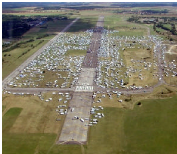
DES MILLIERS DE CARAVANES BLANCHES ONT CONVERGÉ DES QUATRE COÛNS DE FRANCE SUR UN TERRAIN D'AVIATION DÉSACCTÉ POUR QUE 15.000 TSIQANES CÉLÈBRENT JÉSUS (TRADUIRE Wycliffe – Juill SEPT 2010)

Belgique : CENTRE DE PRÉVENTION DU SUICIDE 0800 32 123